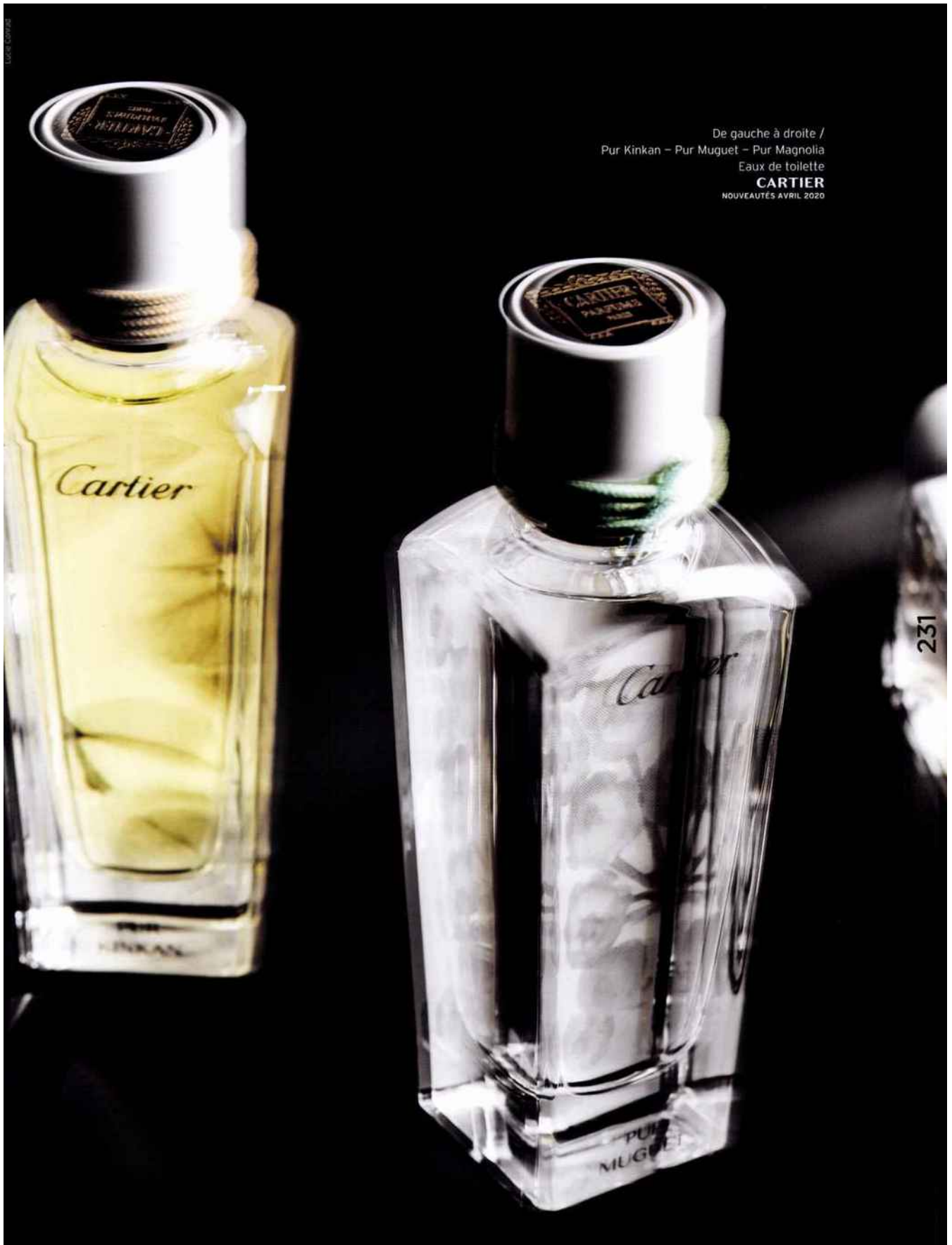
De gauche à droite / Pur Kinkan – Pur Muguet – Pur Magnolia Eaux de toilette CARTIER NOUVEAUTÉS AVRIL 2020