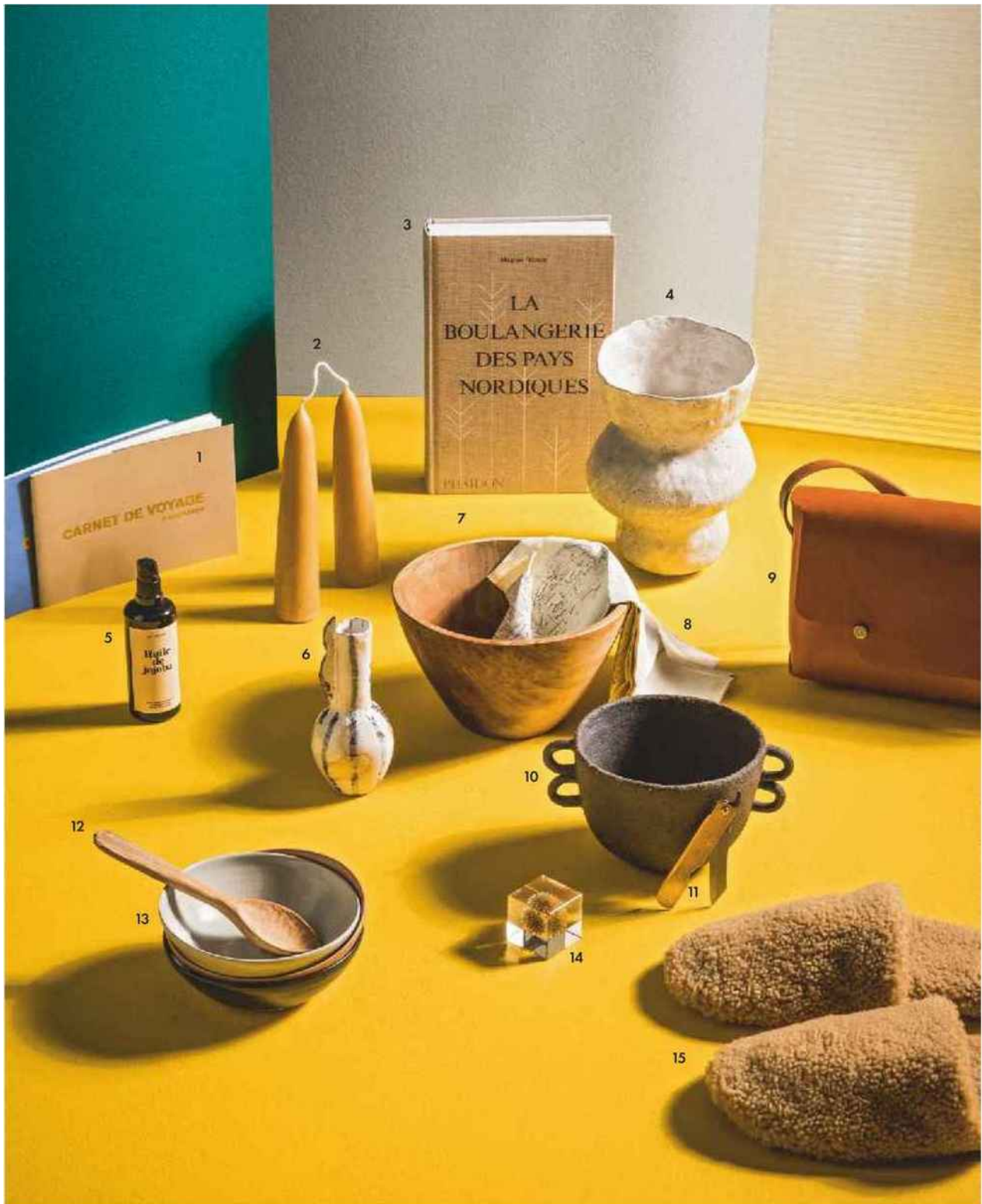
1. Carnets de voyage à illustrer, Superéditions, 15 € l'un. 2. Bougies, Moorland Candles chez Titlee, 28 €. 3. Livre « La Boulangerie des pays nordiques », de Magnus Nilsson (éd. Phaidon), 49,95 €. 4. Vase en grès, Lucile Boudier pour Nous Paris, 180 €. 5. Huile de jojoba, Ma Thérapie, 100ml, 36 €. 6. Vase « Mir », Astérisque chez Brutal Ceramics, 49 €. 7. Bol en bois, Le Vide Grenier d'une Parisienne, 40 €. 8. Foulard « Beyrouth Damas/Al Jauf », Bonhomme, 95 €. 9. Sac en cuir « n°2 Le Moyen - Whisky », Archipel, 315 €. 10. Bol en grès noir chamotté « Récipient 01 », Mano Mani disponible chez Ailleurs Paris, 190 €. 11. Couteau pliant, Higonokami, La Trésorerie, 39 €. 12. Petits bols en céramique, Marion Giaux industriel, 79 € les 4, disponibles jusqu'au 23 décembre sur kisskissbankbank.com/fr/projects/mariongraux . 13. Cuillère en bois, Knieja Wood chez Titlee, 60 €. 14. Inclusion végétale « Oursin à tête ronde », Koichi Yoshimura chez The Conran Shop, 45 €. 15. Chaussons « Hotel », Toasties, 140 €.